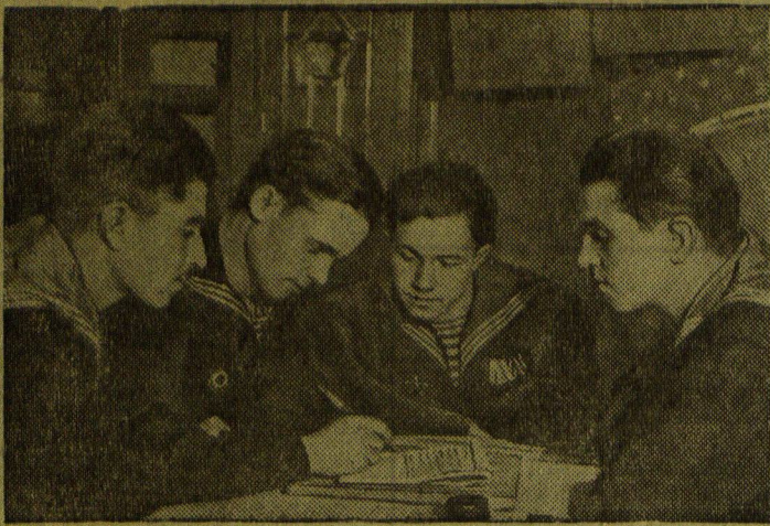
В ДНИ Великой Отечественной войны на средства комсомольцев и молодежи Кзыл-Ординской области Казахской ССР была построена подводная лодка, названная «Герой Советского Союза Нурсентов». На снимке: комсомольцы подводной лодки пишут письмо комсомольцам Кзыл-Ординской области.